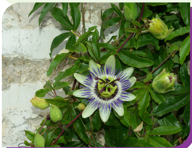
Passiflore Passiflora incarnata

Hauteur : 4 à 7 m Sol : Frais Floraison : Mai à octobre Installation : sur clôture